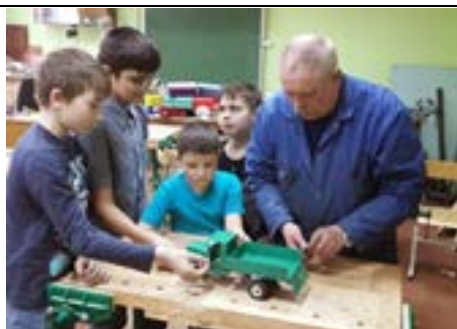
Кабинет № 101 «Автомоделирование»