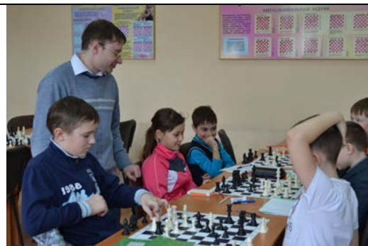
Кабинет №401, «Шахматное королевство»