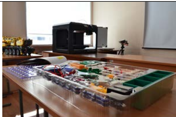
Кабинет №305 «Робототехника»