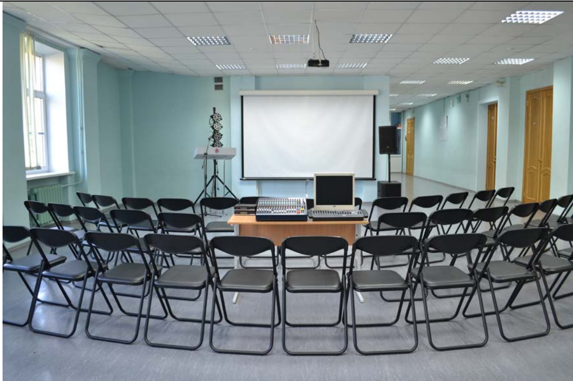
Помещение для проведения семинаров, конференций на 60 посадочных мест.