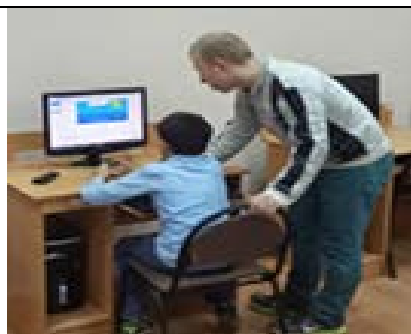
Кабинет № 409 «WEB-мастер»