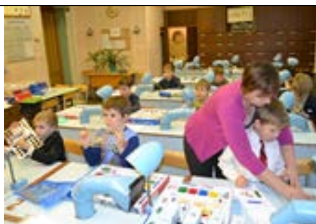
Кабинет № 211 «Начальное техническое моделирование», « Стендовое моделирование»