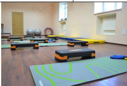
Кабинет № 104 « Цирковое искусство», «Хип-хоп»