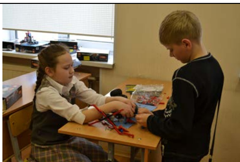
Кабинет № 305 «Робототехника»