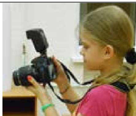
Кабинет №404 «Фотостудия»