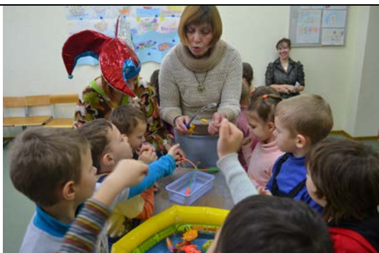
Кабинет № 212 «Мир воды»