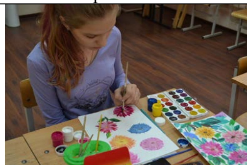
Кабинет № 103 «Живопись, рисунок, композиция»